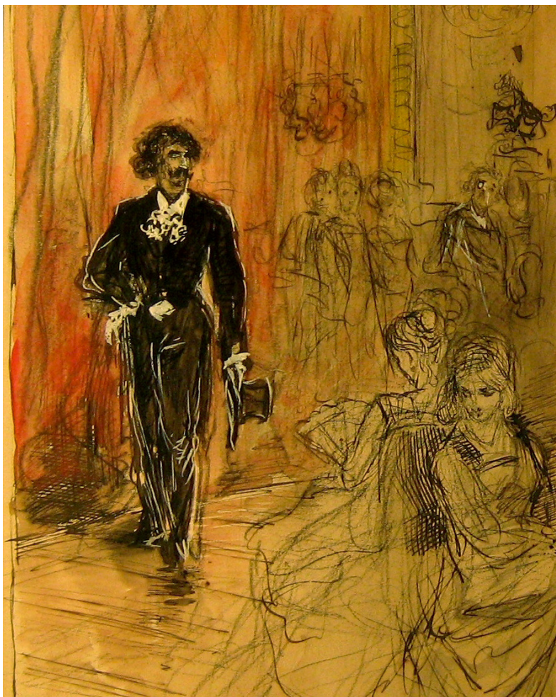
J. Barbey d'Aureville par F. Buhot, coll. musée des beaux arts de Cherbourg