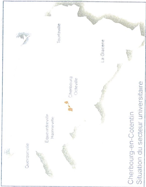
Cherbourg-en-Cotentin Situation du secteur universitaire