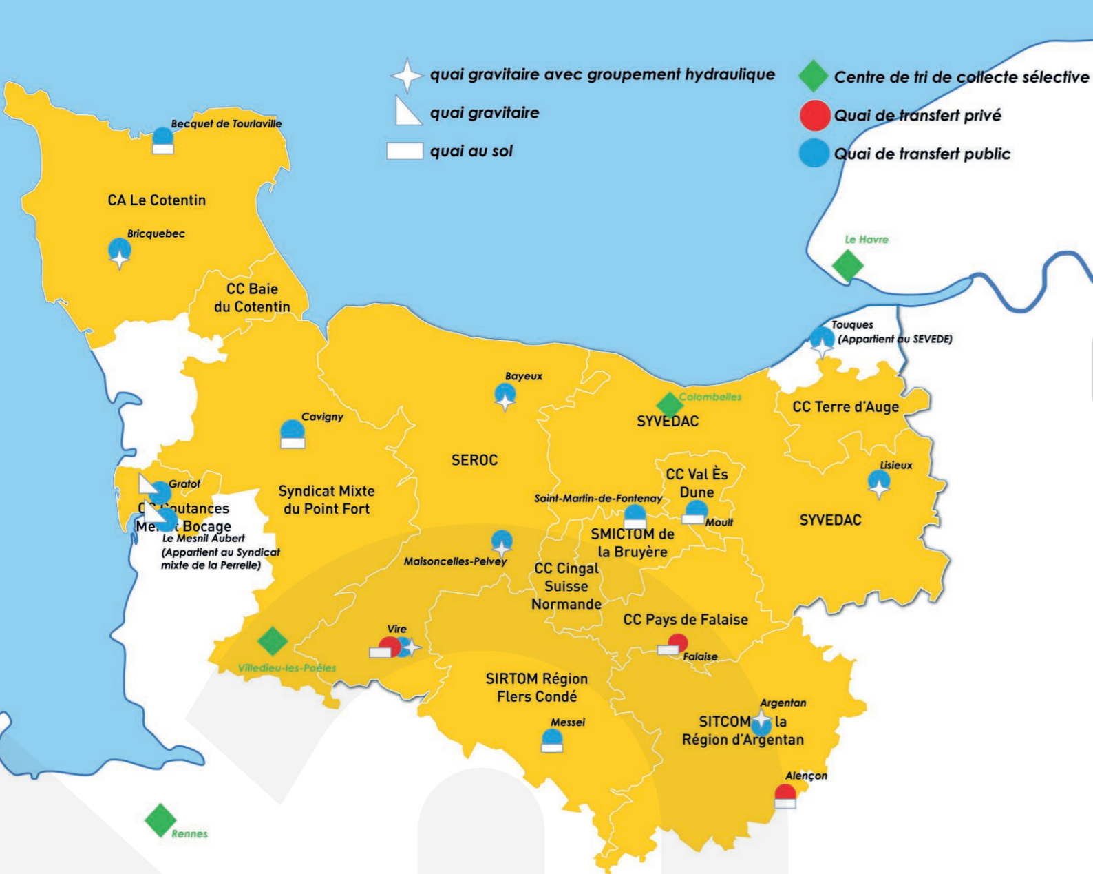
Emplacements et types des quais de transfert des collectes sélectives (2021)