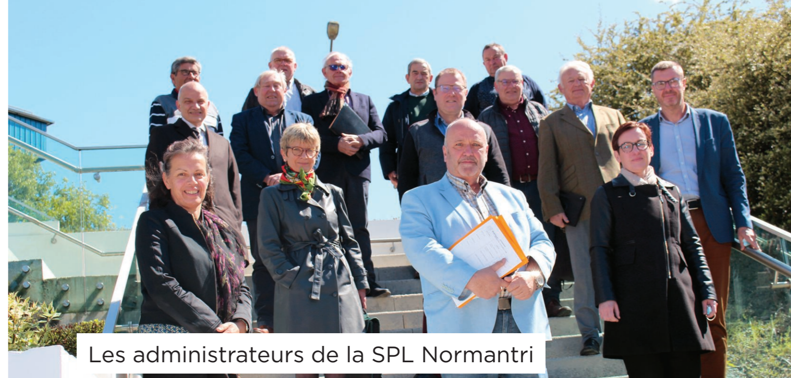
Les administrateurs de la SPL Normantri