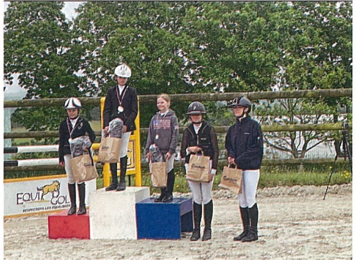
Nos médaillés au Championnat de la Manche de CSO