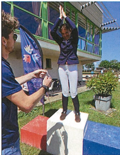
Notre médaillée au Championnat de la Manche d'équitation adaptée