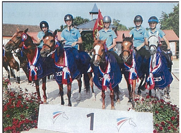
Nos médaillés au Championnat de France de Pony-Games