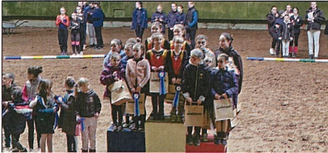
Nos médaillés au Championnat de la Manche de voltige